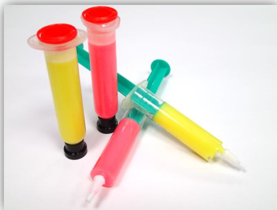
ELSOLD Colored Tacky Fluxes sind in den Farben neon-gelb und neon-pink erhältlich.